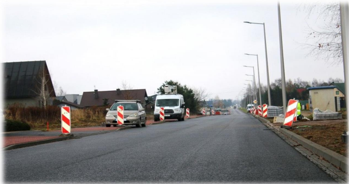
fot. Prace wykończeniowe przy przebudowie drogi powiatowej nr 1751E - ul. Reymonta w Sieradzu

„Przebudowa drogi powiatowej nr 1751E – ul. Reymonta w Sieradzu” dł. 1,23 km. Wartość 5.464.099,08 zł. Zadanie zrealizowano w ramach środków z Rządowego Funduszu Rozwoju Dróg oraz Rządowego Funduszu Inwestycji Lokalnych przy współudziale Gminy Miasto Sieradz. Środki RFRD – 3.637.649,00, Środki RFIL – 800.000,00 zł. Środki Gminy Miasta Sieradz – 950.000,00, środki własne – 76.450,08 zł.