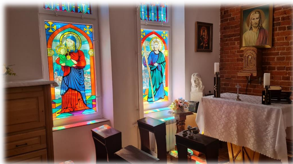
fot. Kaplica DPS Biskupice

Usługi w zakresie świadczeń internistycznych świadczy Niepubliczny Zakład Opieki Zdrowotnej MEDICUS w Sieradzu, a w zakresie opieki psychiatrycznej Szpital Wojewódzki w Sieradzu - Centrum Psychiatryczne w Warcie. W 2021 roku hospitalizowanych było 48 mieszkańców.