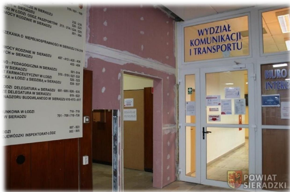
fot. W 2021 kontynuowano realizację inwestycji pod nazwą „Dostosowanie istniejącego budynku A Starostwa Powiatowego w Sieradzu do aktualnych przepisów p-poż