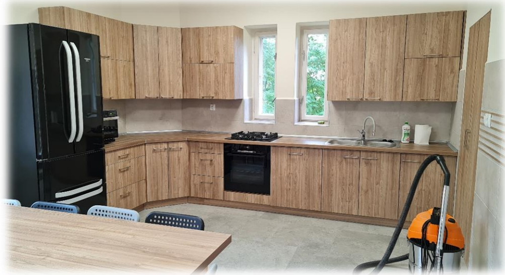
Fot. Utworzenie pomieszczenia socjalnego dla pracowników