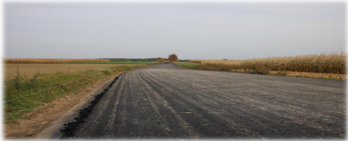
fot. Przebudowa drogi powiatowej Ciepeliów - Wilczków - Klonów

Województwa Łódzkiego – 347.660,00, środki Gminy Goszczanów – 690.886,31 zł, środki własne – 690.886,32 zł.