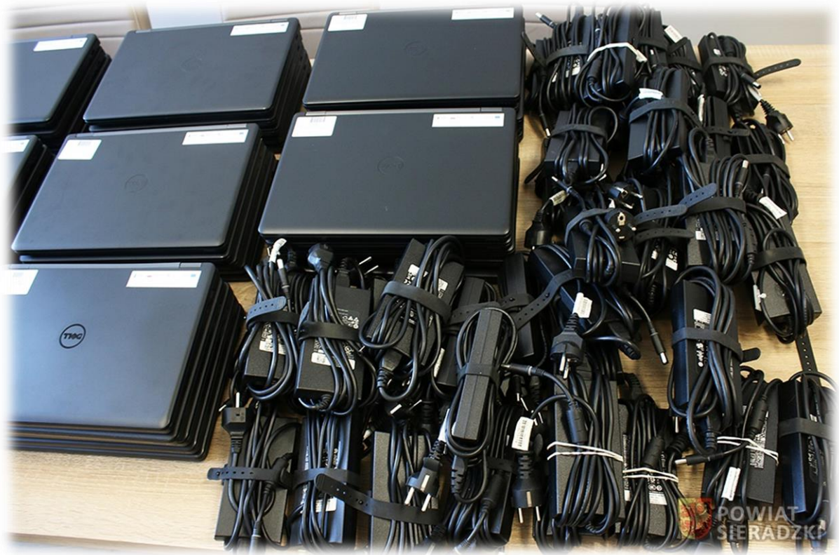
fot. Sprzęt zakupiony dzięki pozyskanej dotacji zewnętrznej

Kwota ta została pozyskana w ramach realizacji projektu „Zdalna Szkoła – wsparcie Ogólnopolskiej Sieci Edukacyjnej w systemie kształcenia zdalnego”, współfinansowanego ze środków Europejskiego Funduszu Rozwoju Regionalnego w ramach Programu Operacyjnego Polska Cyfrowa na lata 2014-2020.