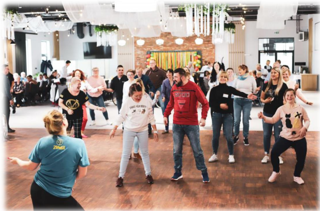
fot. Uczestnicy projektu „Centrum dla Rodzin w Powiecie Sieradzkim” podczas integracji jesiennej