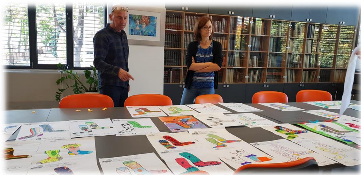
Fot. Konkurs „Skarpetki Nie Od Parady”

W okresie trwania pandemii biblioteka była otwarta i wprowadzała zasady bezpieczeństwa zgodnie z rekomendacjami Biblioteki Narodowej, MKiDN i GIS oraz odpowiednimi regulacjami prawnymi. Na terenie biblioteki, na stronie internetowej i profilu fejsbukowym zamieszczano na bieżąco informacje dotyczące otwarcia biblioteki i warunków korzystania z usług. Zwrócone przez czytelników książki poddawane były kwarantannie w oddzielnym pomieszczeniu na okres trzech dni. Dezynfekowano blaty, klamki, urządzenia techniczne oraz wietrzono pomieszczenia biblioteki. Mimo obostrzeń związanych z pandemią w placówce zrealizowano wiele wydarzeń, a czytelnicy mieli stały dostęp do wypożyczalni.