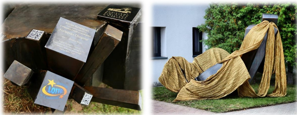
Fot. Rzeźba plenerowa „Fortepian Chopina”

W ramach poszukiwania dodatkowych źródeł finansowania działalności statutowej biblioteka opracowała i złożyła wnioski z których jeden otrzymał dofinansowanie od Fundacji LOTTO im. Haliny Konopackiej - pod nazwą „Fortepian Chopina” w ramach programu „Patroni Roku 2021”. Wartość projektu: 19 500 zł, wnioskowana kwota: 19 500 zł, bez wkładu własnego.