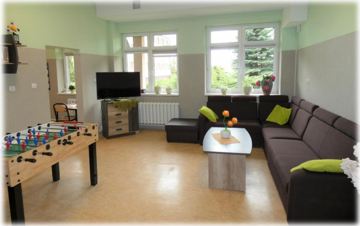
fot. Wnętrza ŚDS w Sieradzu