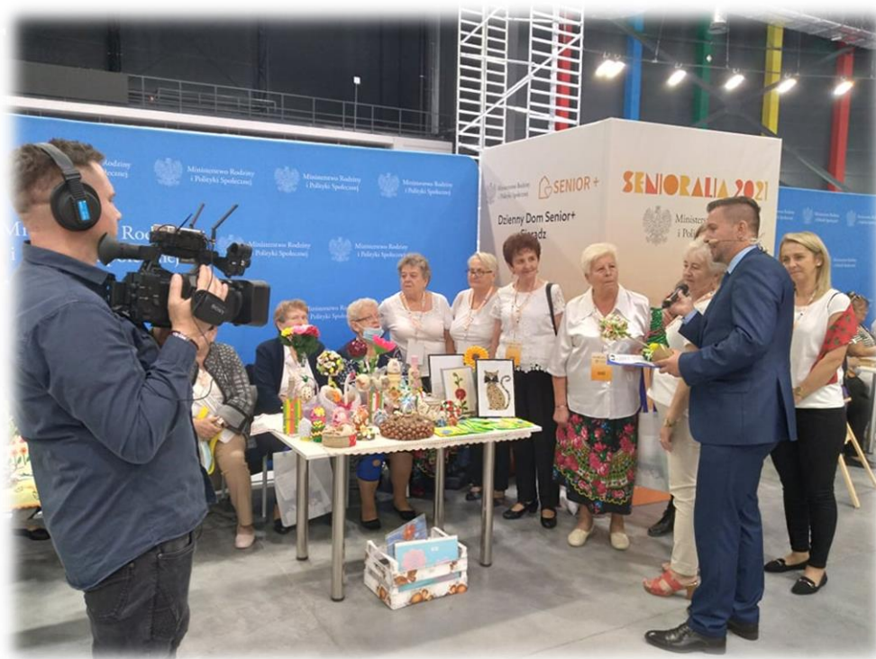
fot. Uczestnicy Dziennego Domu Senior+ reprezentowali nasz powiat na Ogólnopolskich Senioraliach 2021