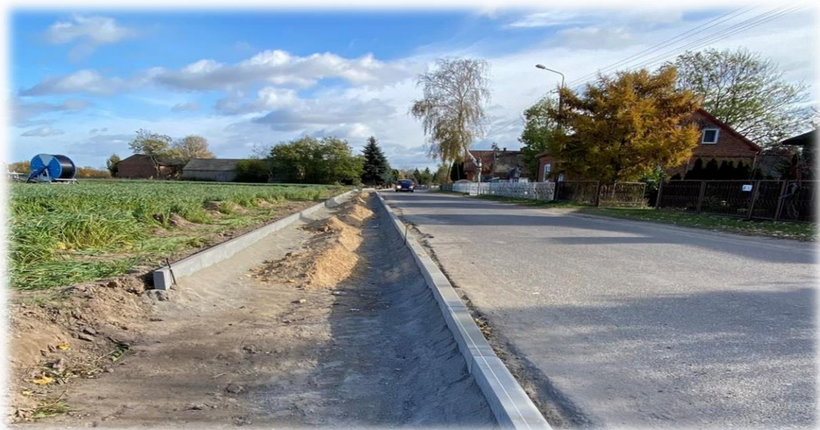
fot. prace remontowe przy chodniku w Jakubicach

„Przebudowa odcinka drogi powiatowej nr 1719E w miejscowości Jakubice poprzez wykonanie chodnika” o dł. 392 m. Wartość 364.239,14 zł. Zadanie zrealizowano w ramach środków własnych przy współudziale Gminy Warta. Środki Gminy Warta – 182.119,57 zł, środki własne – 182.119,57 zł.