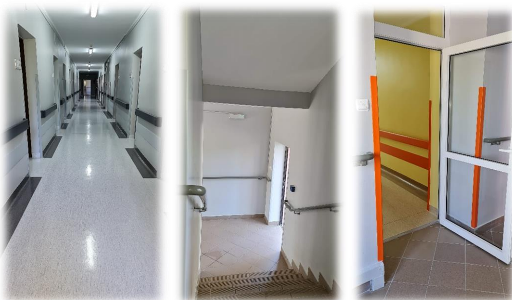
fot. Remont ciągów komunikacyjnych w pawilonie A