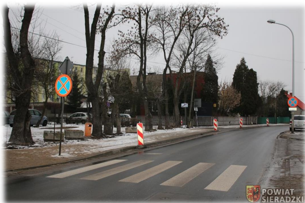
fot. Piesi mogą już swobodnie przejść wzdłuż ulicy Targowej.

Zakończono, rozpoczęte w roku 2020 zadanie: „Przebudowa ulicy Krakowskie Przedmieście i ulicy Targowej w Sieradzu poprzez ułożenie nowej nawierzchni asfaltowej i przebudowę chodnika” długości 0,680 km. Roboty budowlane zostały zakończone w 2021 roku. Wartość robót 426.125,39 zł.