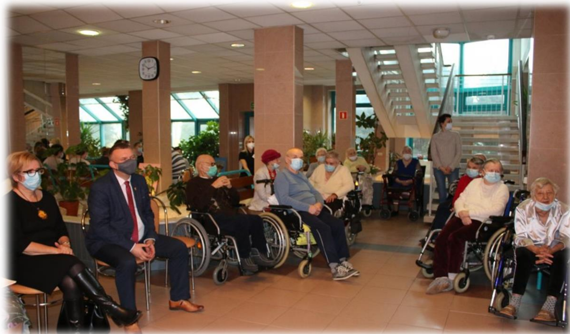
Spotkanie z okazji Dnia Seniora

W ramach powyższego grantu wykorzystano kwotę 147.275,73 zł, niewykorzystaną kwotę przekazano do zwrotu w wysokości 1.654,03 zł.