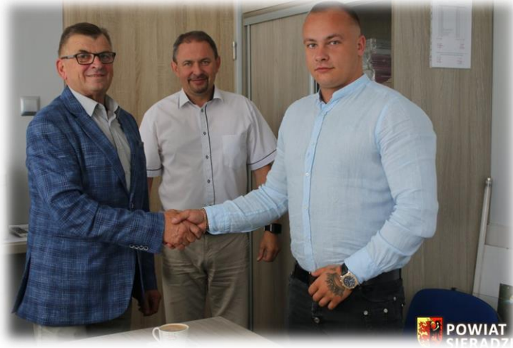
fot. Podpisanie Umowy na realizację przebudowy drogi powiatowej nr 1700E

„Przebudowa drogi powiatowej nr 1751E – ul. Reymonta w Sieradzu” dł. 1,23 km. Wartość 5.464.099,08 zł. Zadanie zrealizowano w ramach środków z Rządowego Funduszu Rozwoju Dróg oraz Rządowego Funduszu Inwestycji Lokalnych przy współudziale Gminy Miasto Sieradz. Środki RFRD – 3.637.649,00, Środki RFIL – 800.000,00 zł. Środki Gminy Miasta Sieradz – 950.000,00, środki własne – 76.450,08 zł.