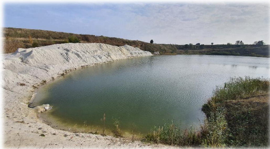
fot. Jeden z terenów poddanych rekultywacji